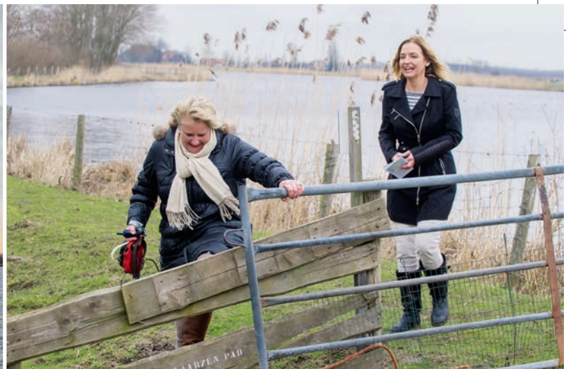
Wie het Laarzenpad volgt, komt af en toe hindernissen tegen.

proces van haar moeder gelukkig niet alleen verdrietig was: “Bukte ik om een dvd van haar geliefde André Rieu in de speler te stoppen, zei ze rustig: ‘Nou, jij hebt ook een dikke kont!’” Het Laarzenpad maakt zijn naam waar. Af en toe is het soppen en goed uitkijken voor koeienvlaaien, zeker ter hoogte van het zogeheten Driemolenpunt. Daar zie je de Kagermolen, Buurtermolen en Lijkermolen precies in één lijn.