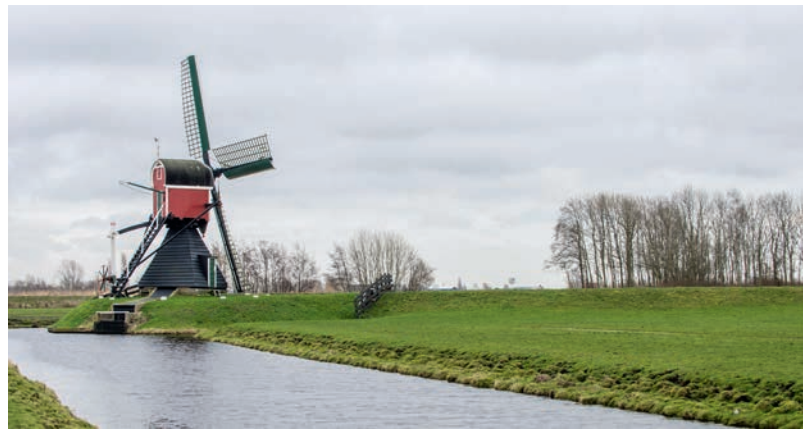
De 17de-eeuwse Kagermolen bemaalt nog steeds de Kaagerpolder.