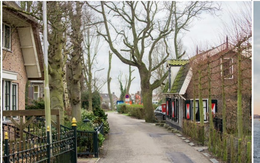
Het dorpje Kaag is alleen te bereiken met een pontje.