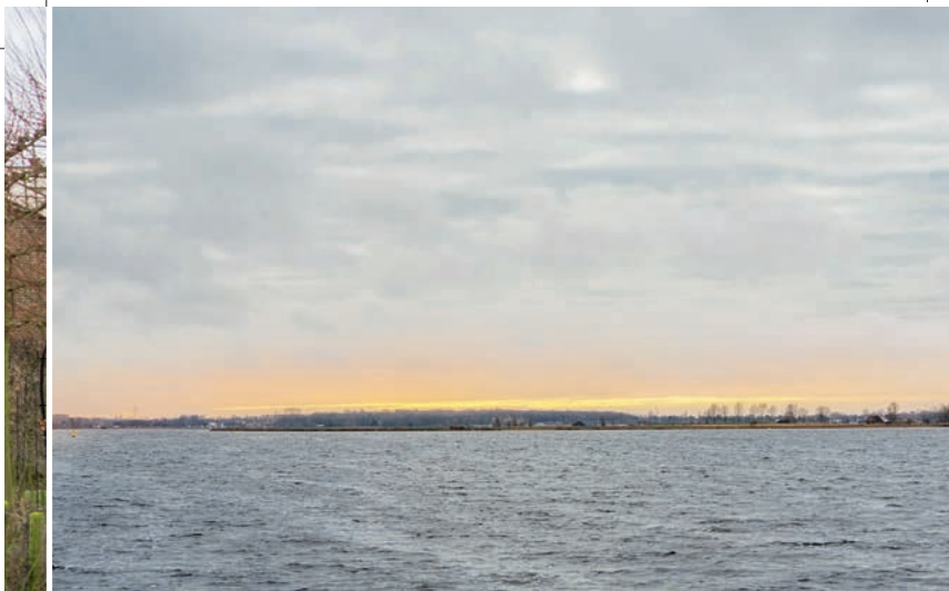
Nu rustig; 's zomers zijn de Kagerplassen populair bij watersporters.